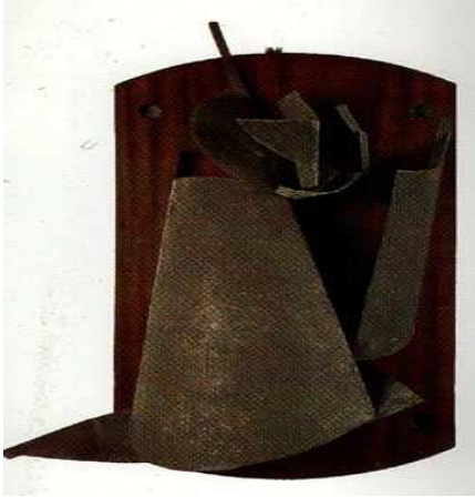
شكل (3) خشب ومعدن

فلاديمير تاتلين Vladimir Tatlin - نحت بارز - ١٩١٤